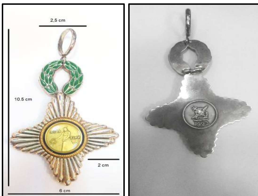
Εικόνα 1: Εμπρόσθια και οπίσθια όψη Αστέρα Αξίας και Τιμής

2. Η ταινία του μεταλλίου μήκους 42 cm, είναι πανομοιότυπη ως προς τον χρωματισμό με την ταινία του μεταλλίου της διαμνημονεύσεως «Αξίας και Τιμής». Ο χρωματισμός της ταινίας να είναι απόλυτα σύμφωνος με το επίσημο δείγμα της υπηρεσίας.