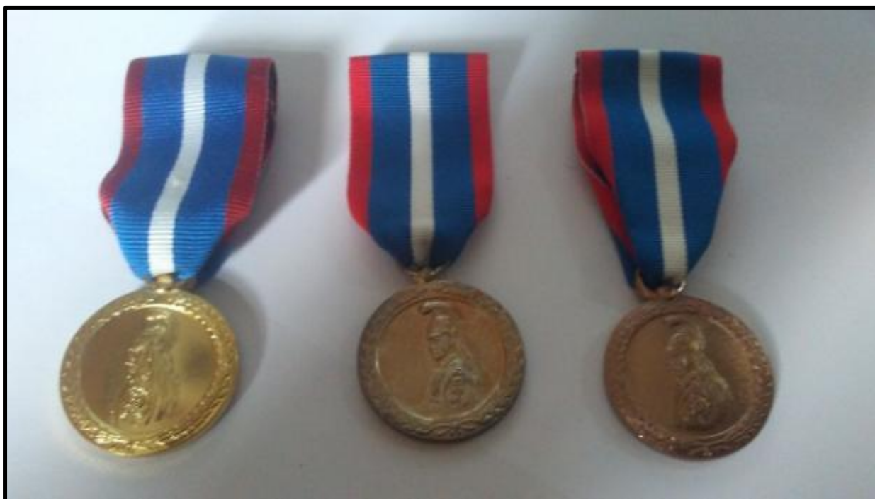
Εικόνα 1: Εμπρόσθια όψη μεταλλίου πολυετούς υπηρεσίας αξιωματικών σωμάτων και κοινών σωμάτων

3. Η καρφίτσα του μεταλλίου έχει τα τεχνικά χαρακτηριστικά της Προσθήκης VI.