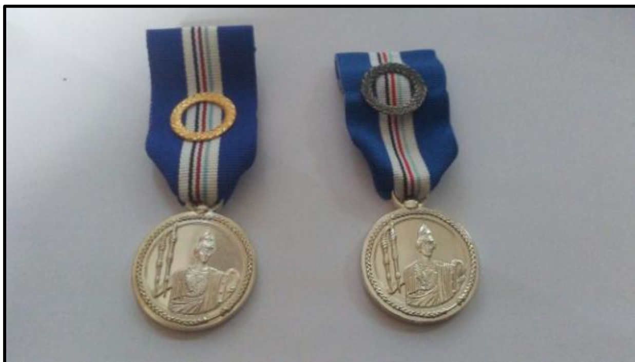
Εικόνα 1: Εμπρόσθια όψη μεταλλίου υπηρεσιών αξιωματικού επιτελούς

3. Η καρφίτσα του μεταλλίου έχει τα τεχνικά χαρακτηριστικά της Προσθήκης VI.