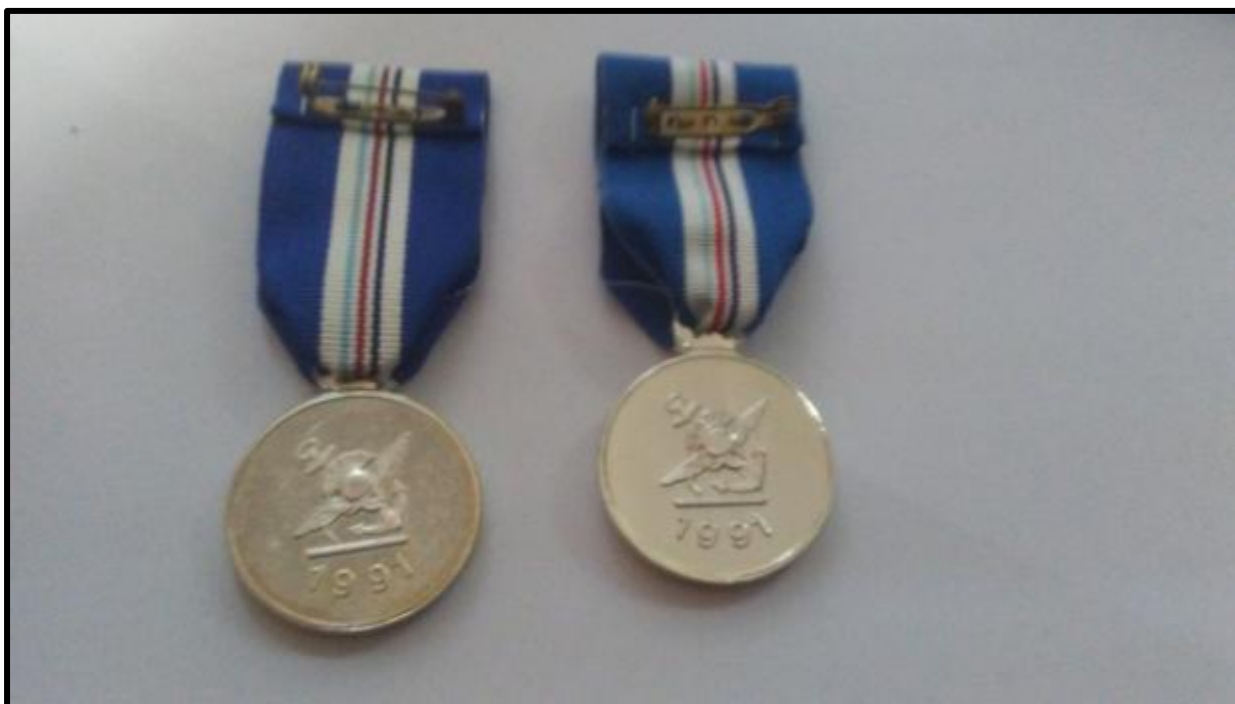
Εικόνα 2: Οπίσθια όψη μεταλλίου υπηρεσιών αξιωματικού επιτελούς