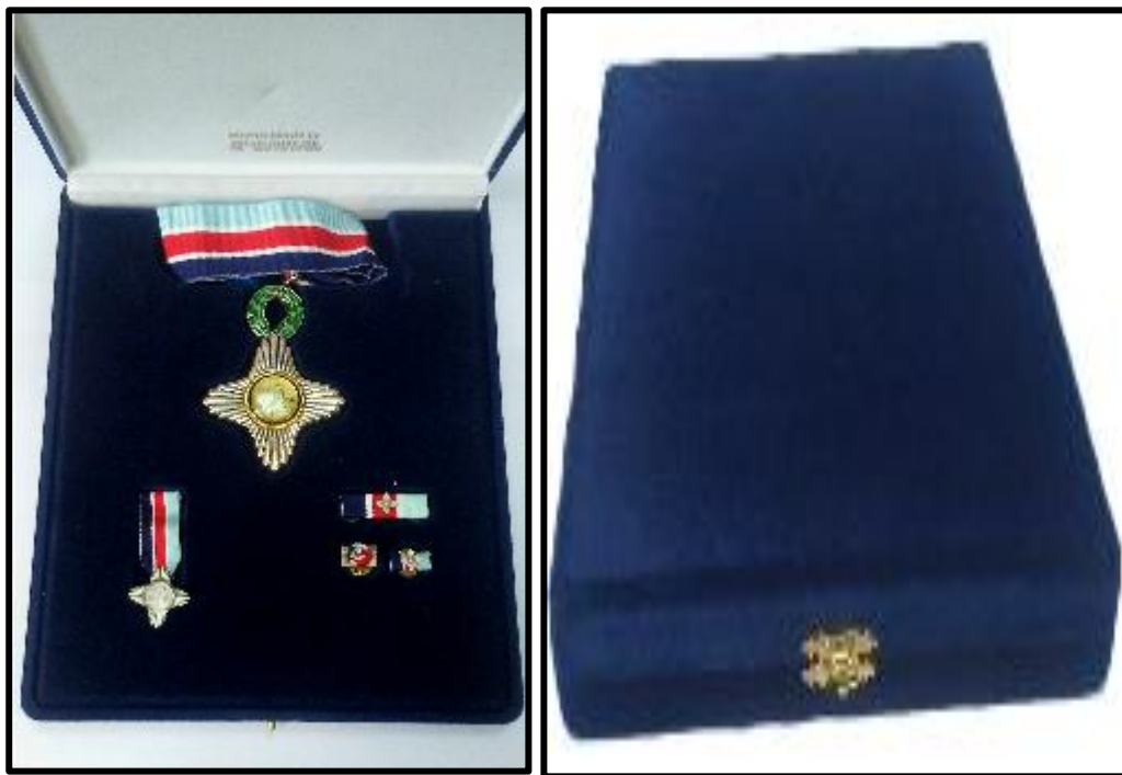
Εικόνα 3: Κασετίνα συσκευασίας Αστέρα Αξίας και Τιμής και των παρελκομένων του