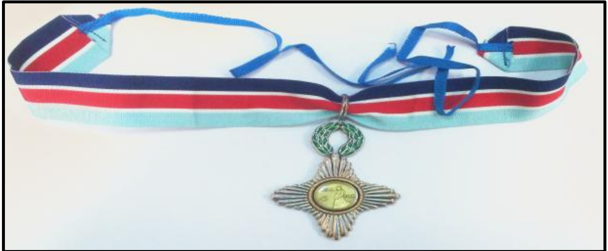
Εικόνα 2: Αστέρα Αξίας και Τιμής μετά της ταινίας ανάρτησης