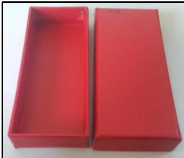
Εικόνα 3: Κουτί Συσκευασίας Μεταλλίου ηγεσίας Σχηματισμού ή μεγάλης Μονάδας