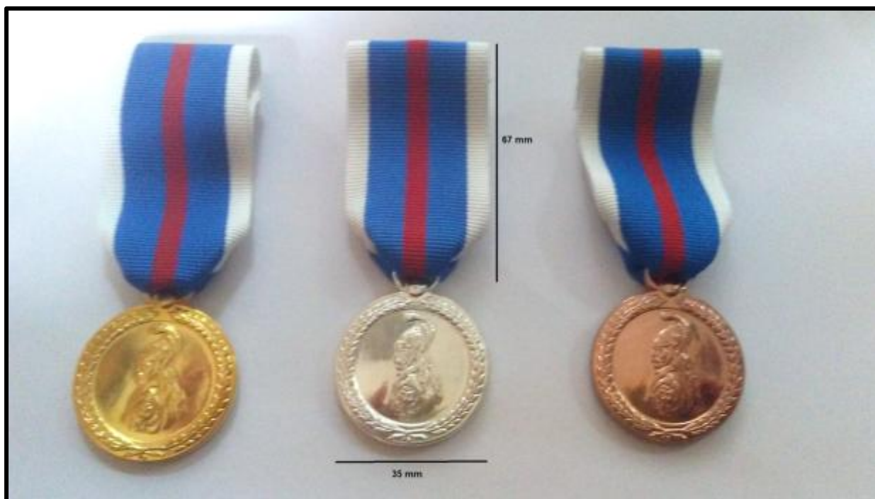
Εικόνα 1: Εμπρόσθια όψη Μεταλλίου Ευδόκιμου Διοικήσεως

3. Η καρφίτσα του μεταλλίου έχει τα τεχνικά χαρακτηριστικά της Προσθήκης VI.