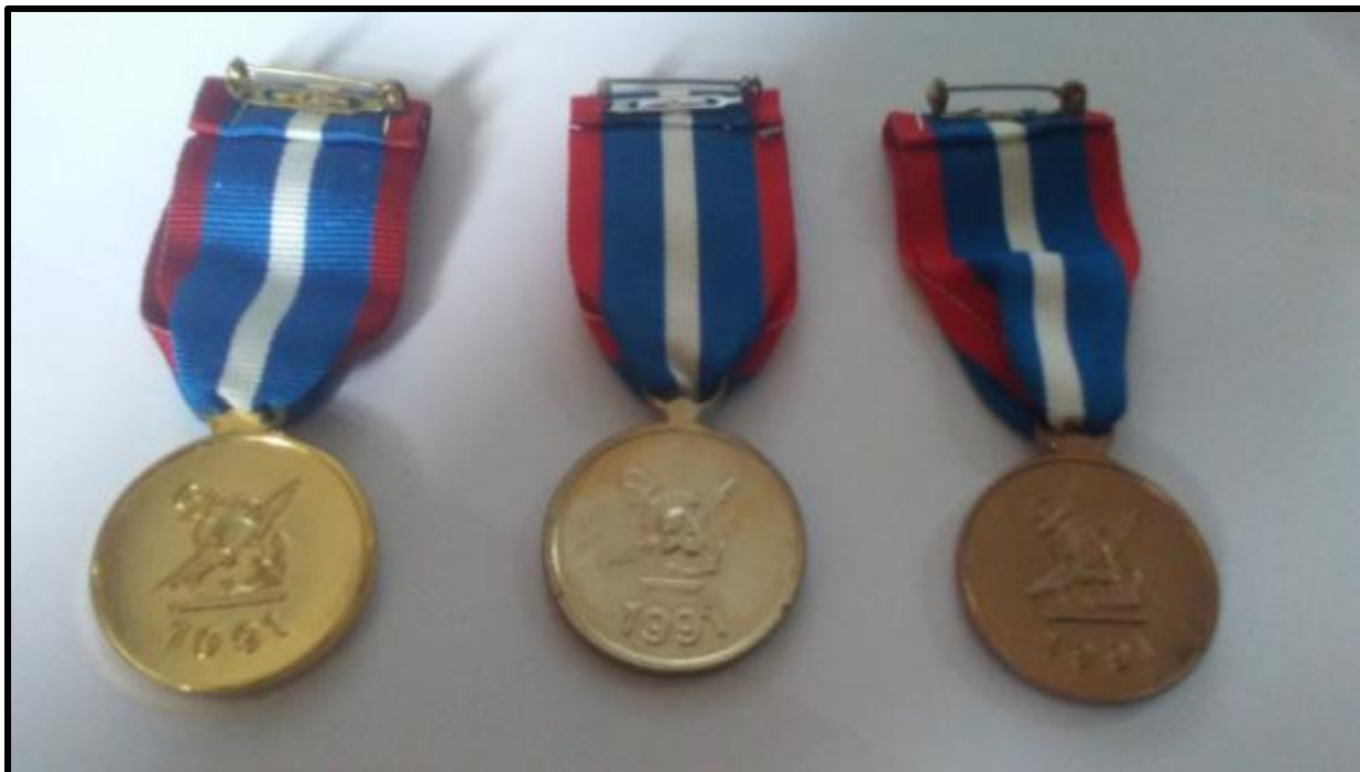
Εικόνα 2: Οπίσθια όψη μεταλλίου πολυετούς υπηρεσίας αξιωματικών σωμάτων και κοινών σωμάτων