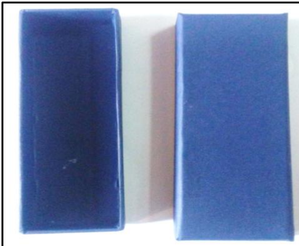
Εικόνα 3: Κουτί Συσκευασίας Μεταλλίου Ευδόκиму Διοικήσεως