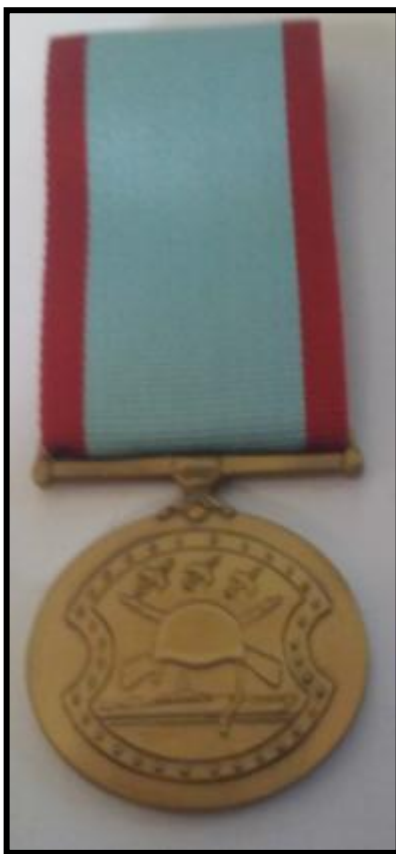
Εικόνα 1: Εμπρόσθια όψη μεταλλίου ηγεσίας Σχηματισμού ή μεγάλης Μονάδας

3. Η καρφίτσα του μεταλλίου έχει τα τεχνικά χαρακτηριστικά της Προσθήκης VI.