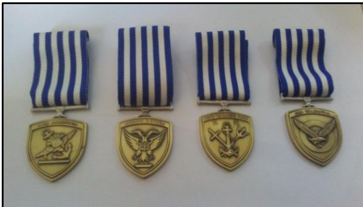
Εικόνα 1: Εμπρόσθια όψη μεταλλίου Αρχηγίας σε Γενικό Επιτελείο

3. Η καρφίτσα του μεταλλίου έχει τα τεχνικά χαρακτηριστικά της Προσθήκης VI.