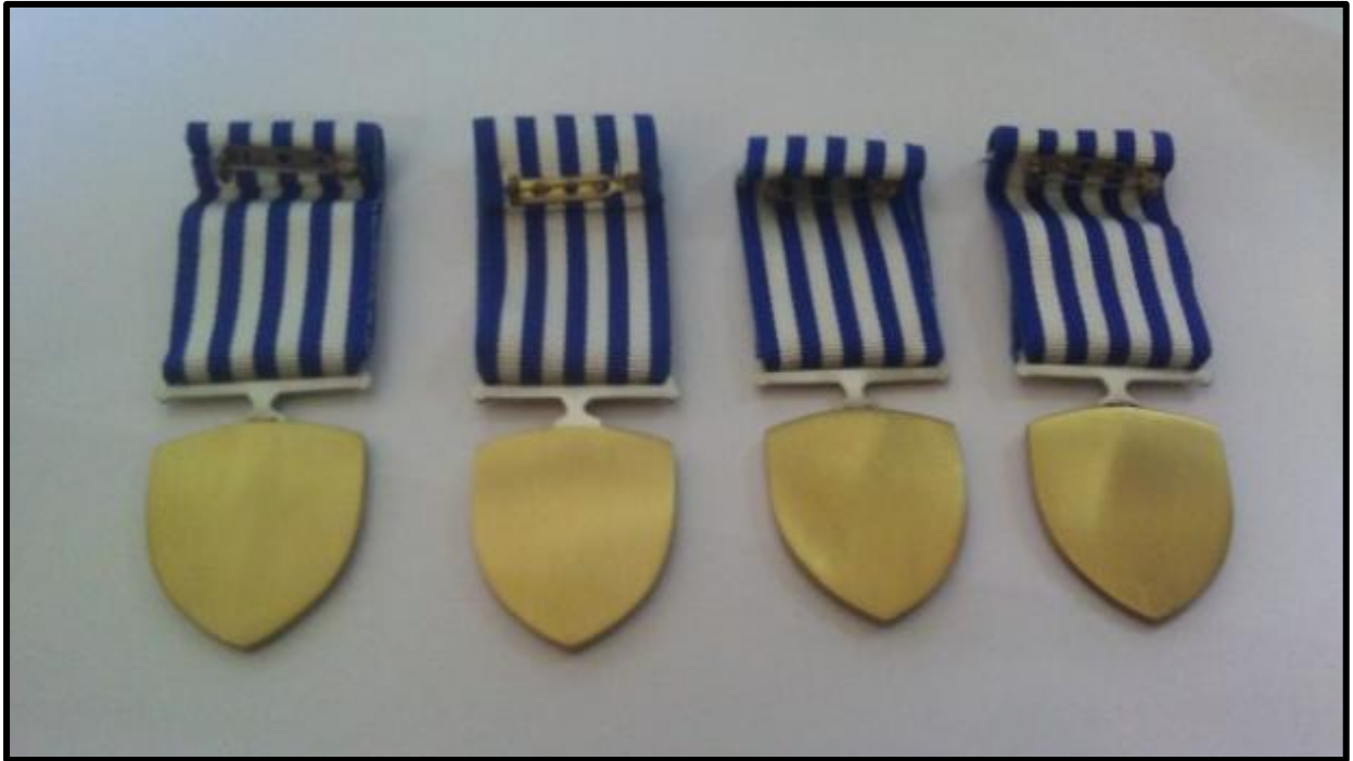
Εικόνα 2: Οπίσθια όψη μεταλλίου Αρχηγίας σε Γενικό Επιτελείο