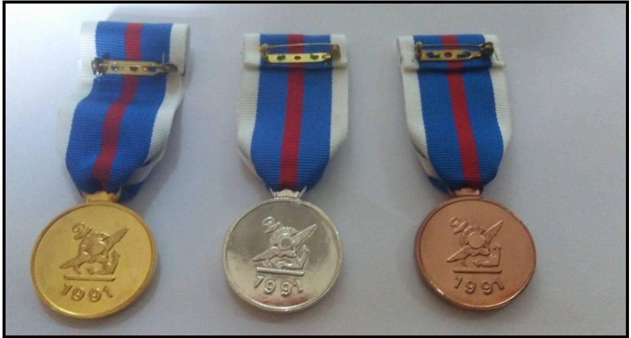
Εικόνα 2: Οπίσθια όψη Μεταλλίου Ευδόκиму Διοικήσεως