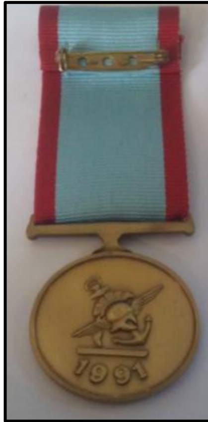
Εικόνα 2: Οπίσθια όψη Μεταλλίου ηγεσίας Σχηματισμού ή μεγάλης Μονάδας