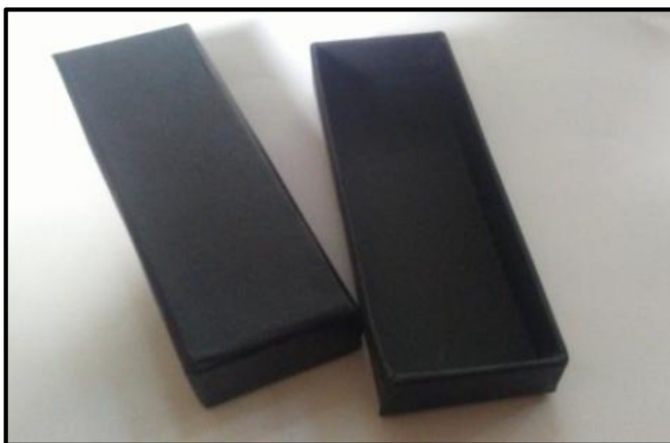
Εικόνα 3: Κουτί συσκευασίας μεταλλίου υπηρεσιών αξιωματικού επιτελούς