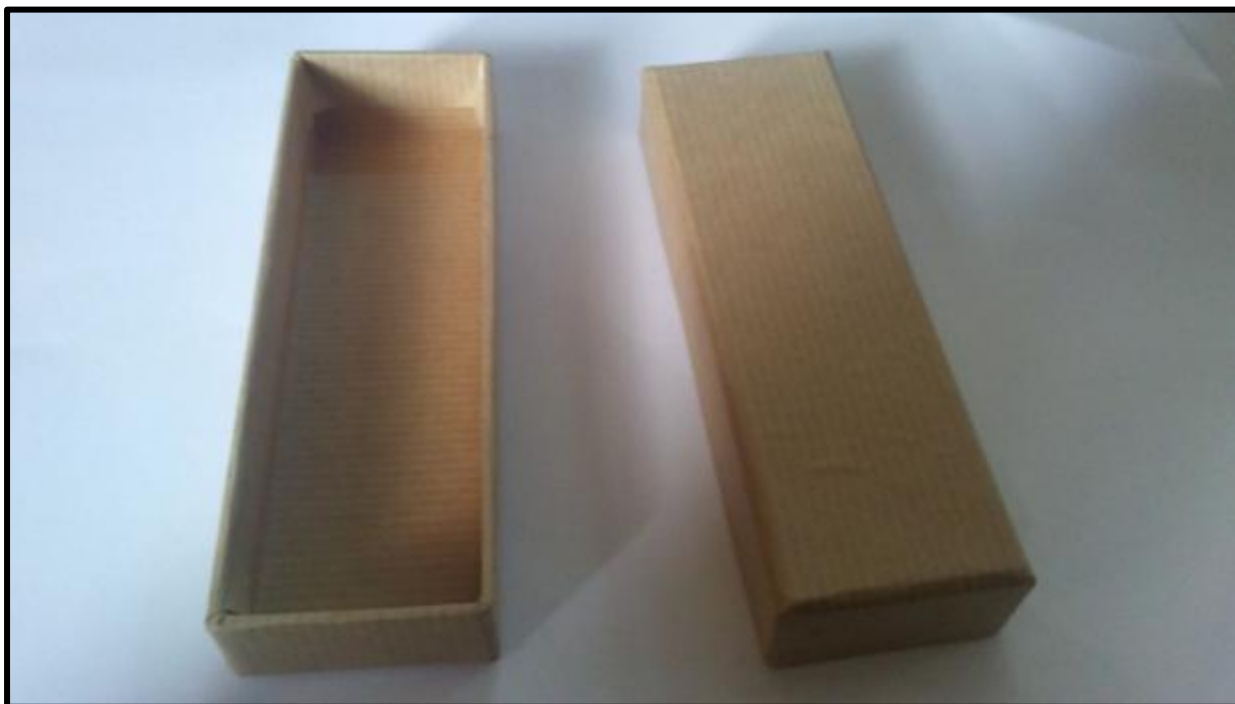
Εικόνα 3: Κουτί συσκευασίας μεταλλίου πολυετούς υπηρεσίας αξιωματικών σωμάτων και κοινών σωμάτων