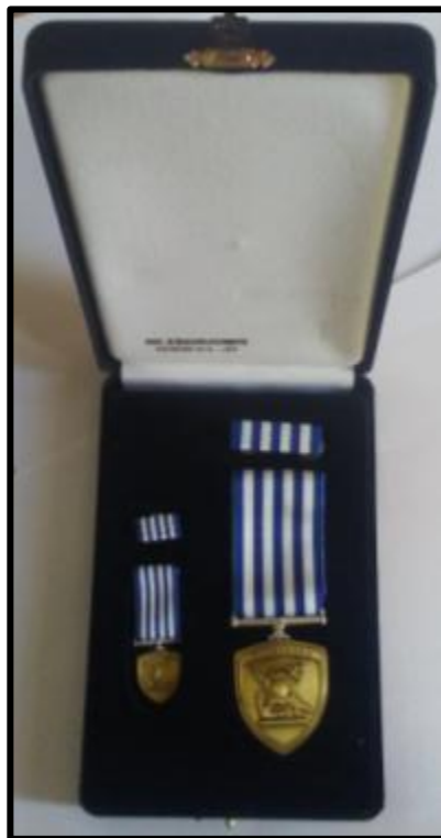
Εικόνα 3: Κασετίνα συσκευασίας μεταλλίου Αρχηγίας σε Γενικό Επιτελείο